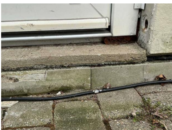
Bild 5: Utvändigt, Ytterdörr, Nedre delen av lister mellan dörr och fasad har lossnat Tröskelplåt saknas till en dörr på gavel...