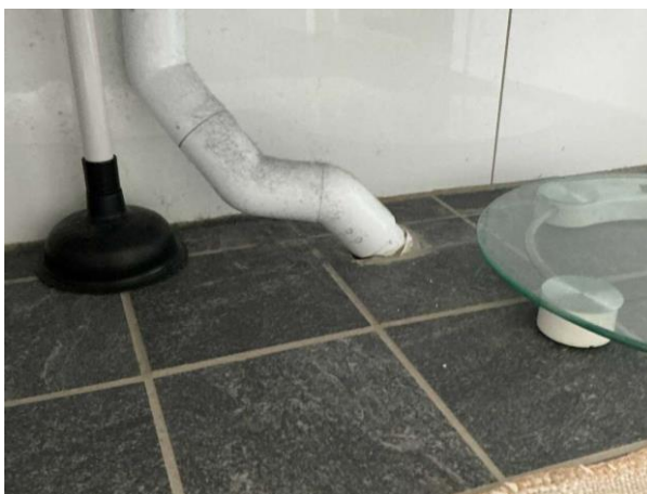
Bild 8: Invändigt, Souterrängplan, Duschrum/tvättstuga, Avloppet under handfatet kommer upp snett genom golvet