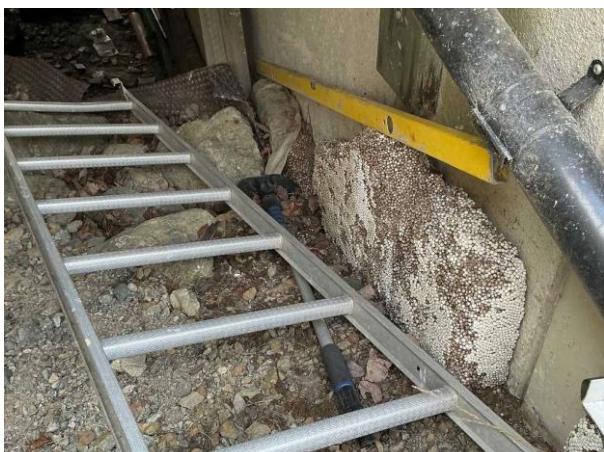
Bild 1: Utvändigt, Grundmur/Hussockel, Topplist saknas delvis till dräneringen (under altanen) samt är dräneringen delvis synlig