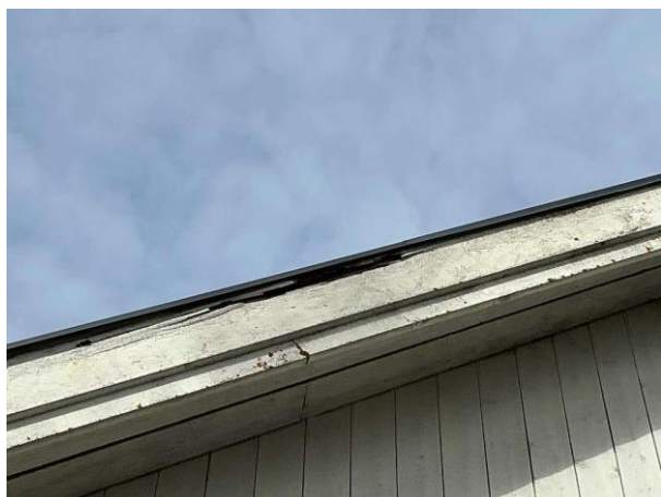
Bild 7: Utvändigt, Yttertak, Rötskadad vindskiva noterades på gaveln vid balkongen